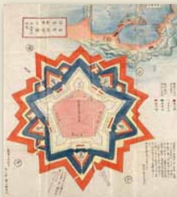
箱館柳野新築陣営之図 (五稜郭図)

〒720-0067 広島県福山市西町2-4-1 TEL 084-931-2513 FAX 084-931-2514 http://www.pref.hiroshima.lg.jp/site/rekishih/ メール rhksoumu@pref.hiroshima.lg.jp