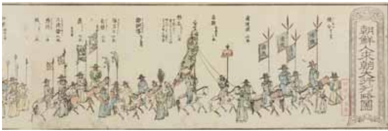
朝鮮人來朝大行列略図（部分）