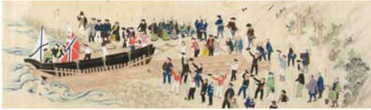
露西亜船建造図巻（部分）