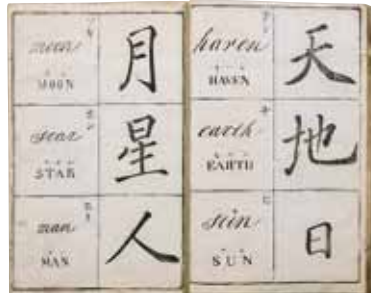
土佐海援隊蔵板 和英通韻以呂波便覧