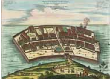
モンタヌス「出島図」